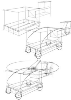
LEKTION 01 GRUNDLAGEN OBJEKTZEICHNEN 01_01_UEBUNGSMETRISSCHE GRUNDFORMEN